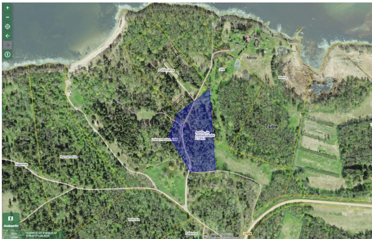
Lisa 3. Asula- ja sadamakoht reg-nr 27891 asukoha kuva Maa-ameti kultuurimälestiste kaardikihil seisuga 30.10.2024. (Alus: Maa-ameti geoportaali kultuurimälestiste kaardikiht)