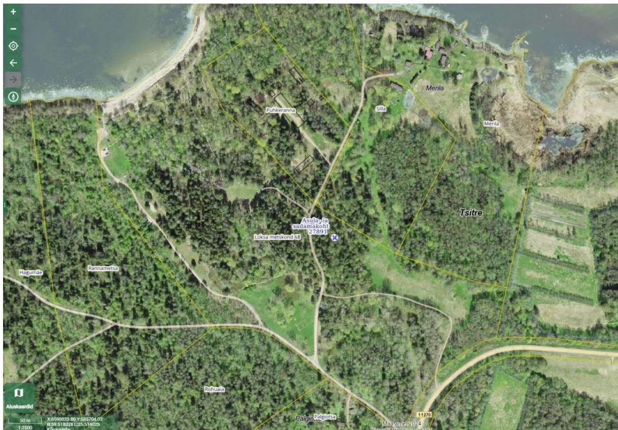
Lisa 1. Asula- ja sadamakoht reg-nr 27891 asukoha leppemärgiga kujutatud kuva Maa-ameti kultuurimälestiste kaardikihil seisuga 15.10.2024. (Alus: Maa-ameti geoportaal kultuurimälestiste kaardikiht)